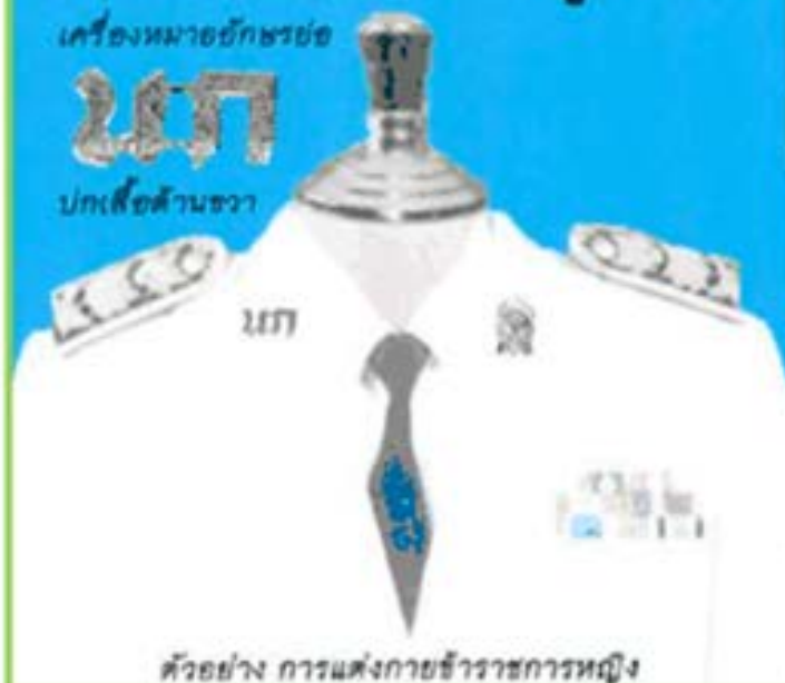
ตัวอย่าง การแต่งกายข้าราชการหญิง