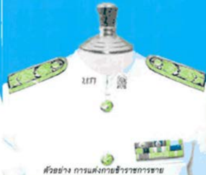
ตัวอย่าง การแต่งกายข้าราชการชาย